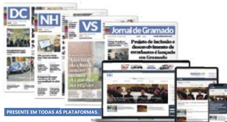
PRESENTE EM TODAS AS PLATAFORMAS.

Em tempos de fake news, os nossos jornais seguem sendo fontes seguras de informação para você.